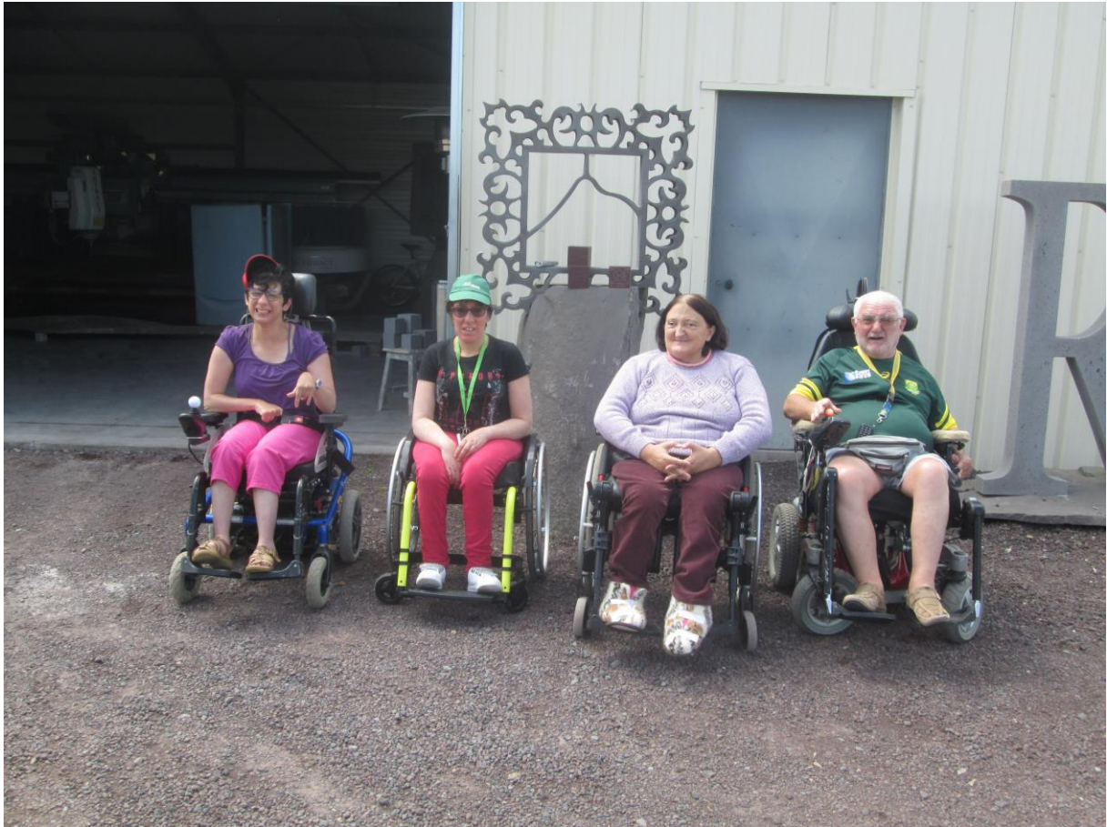
Le groupe de visiteurs